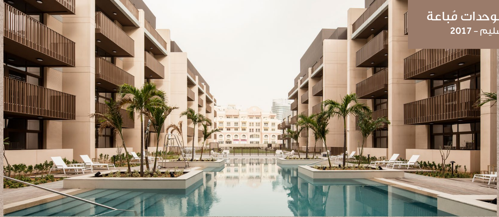
جميع الوحدات مُباعة التسليم - 2017

181 وحدة عصرية مؤلفة من غرفة وغرفتي وثلاث غرف نوم تقع على مساحة من المناظر الطبيعية الخلابة تبلغ 10,000 قدم مربع وتضم حوض سباحة ومنطقة للأطفال وملاعب رياضية وحدائق ومدارس. وقد صُممت كل من الوحدات بعناية فائقة لتلبي مختلف الاحتياجات وتخلق توازنا رائعا بين الأناقة الكلاسيكية والتصميم والتكامل المعاصرين.